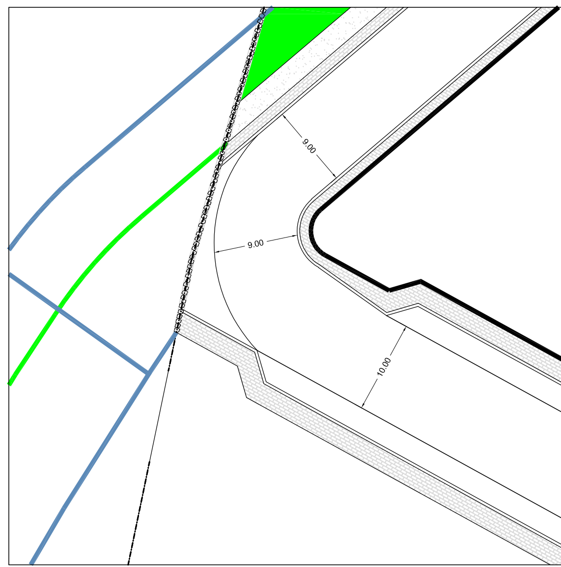
PARTICOLARE ANGOLO TRA STRADA DI PIANO E STRADA DI MARGINE - scala 1:100